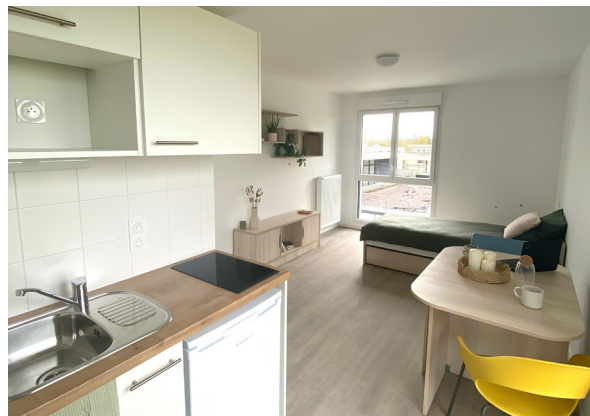
Résidence ALFI-Ker Lann