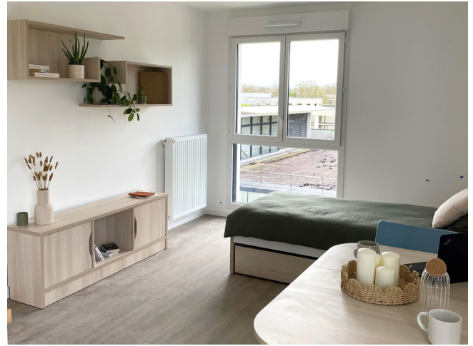
Résidence ALFI-Ker Lann

En parallèle, un projet de pension de famille est en cours de développement à Rennes, boulevard Maréchal de Lattre de Tassigny, avec une ouverture prévue d'ici fin 2025. La future résidence intégrera 29 places à des personnes isolées, âgées en moyenne de 50 ans, confrontées à des difficultés sociales (addictions, troubles psychiques) et percevant des minima sociaux. Ce type de structure vise à apporter un accompagnement pérenne aux personnes en grande vulnérabilité, rompant ainsi l'isolement par un cadre de vie adapté et stable.